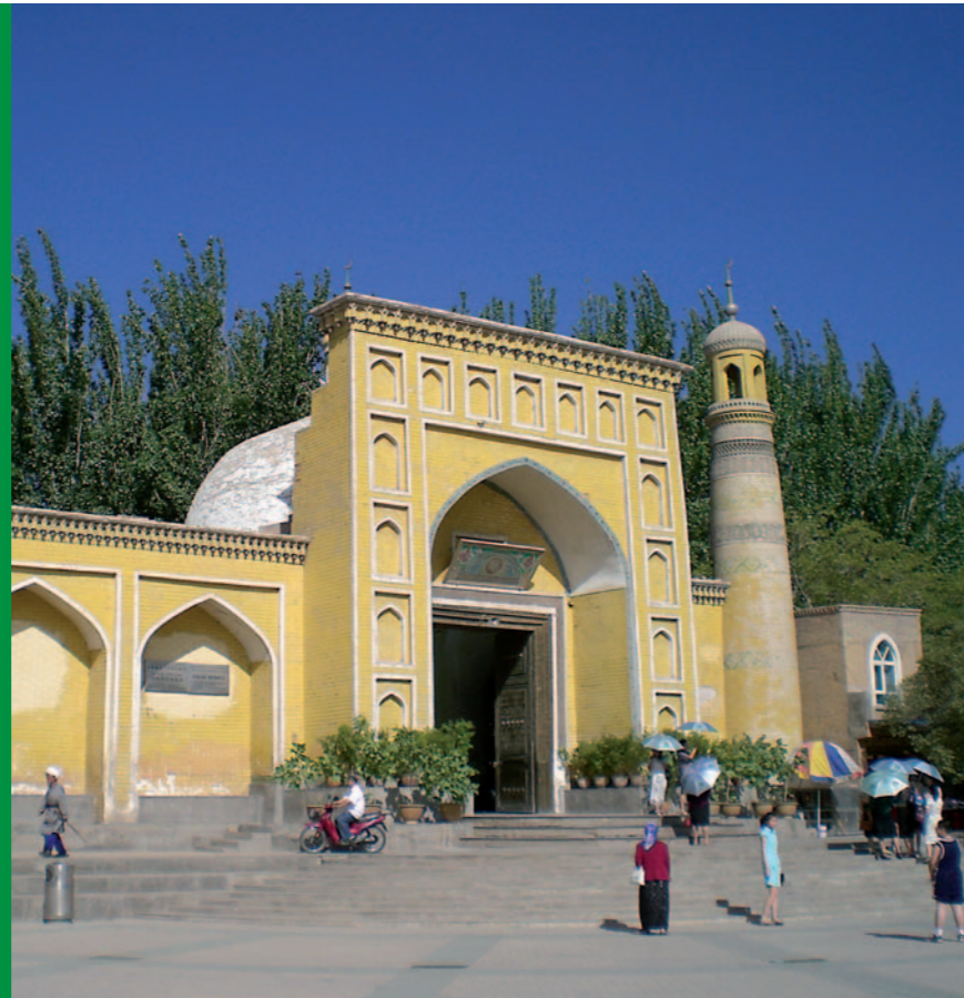
Die Id-Kah-Moschee in Kashgar

Die berühmte Seidenstraße war über mehrere Jahrhunderte der bedeutendste Handelsweg zwischen Ost und West. Die riesigen Karawanen brachten nicht nur Seide und Brokat in Richtung Europa, sondern kamen auch mit allerlei Wertvollem zurück. So findet man heute noch zahlreiche prachtvolle Monumente vor. Entdecken Sie einige der schönsten Abschnitte der Großen Seidenstraße und erleben Sie die eindrucksvollen Zeugnisse vergangener Zeiten.